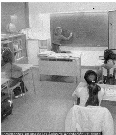
Inmigrantes, en una de las Aulas de Adaptación.

EL NORTE DE CASTILLA / MARTES, 15 DE ENERO DEL 2008