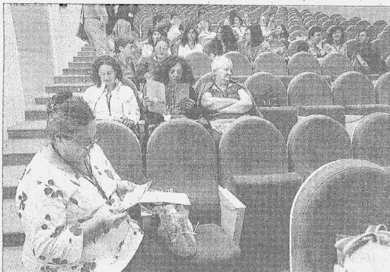
Los participantes de las jornadas antes de la conferencia Inaugural.

Este encuentro para 130 enseñantes con gitanos procedentes de toda España sirve para concienciar a la población y a las administraciones sobre la importan-