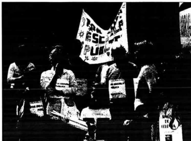
Padres y alumnos se concentraron en la plaza de Santa Teresa antes del comienzo de la manifestación.

Una segunda reivindicación de este colectivo de padres se centra en un reparto equitativo de los alumnos inmigrantes en los centros. «No se debe escolarizar a todos los niños en los mismos centros. Hay que diversificar la cultura en todos los centros, lo que nos beneficiaría a todos, y así no crear guetos, no se posibilita ese intercambio», comentaba Arribas. La tercera gran propuesta de FAPA se centra en reclamar más medios humanos «y más formación al profesorado» para poder afrontar estos retos con las mayores garantías. A